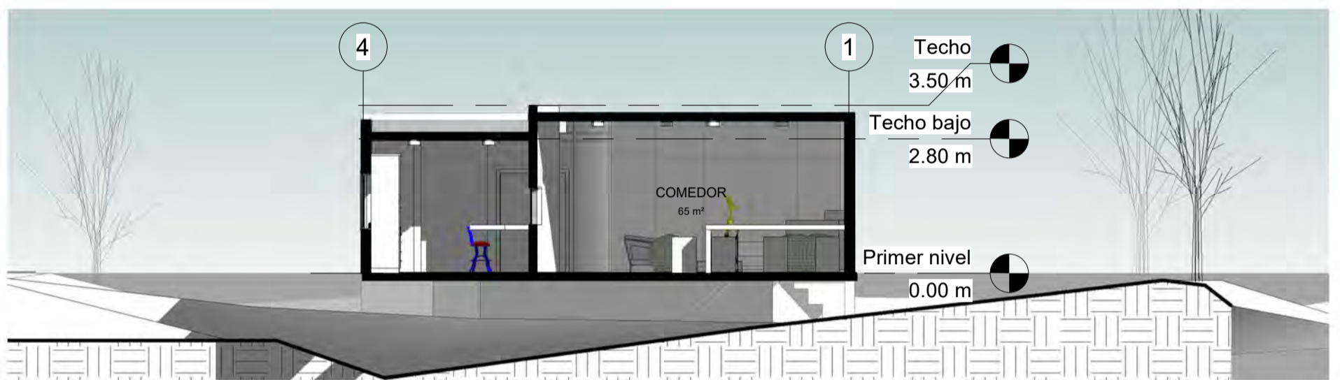
2 CORTE B-B 1 : 100